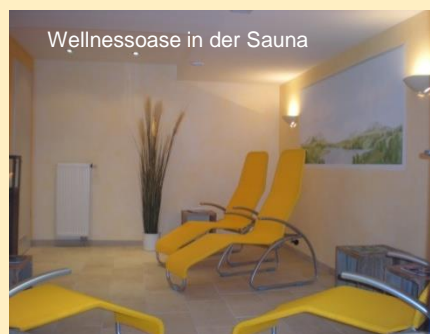
Wellnessoase in der Sauna