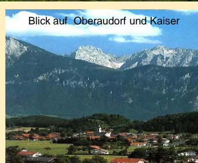
Blick auf Oberaudorf und Kaiser