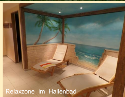
Relaxzone im Hallenbad